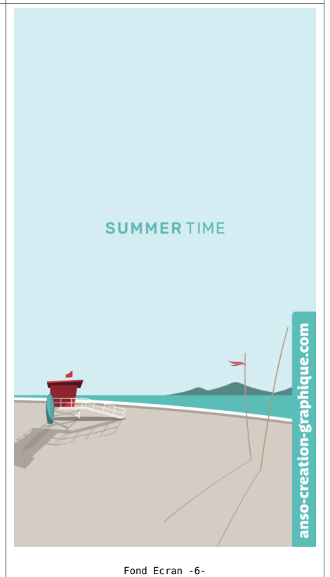
Fond Ecran -6-