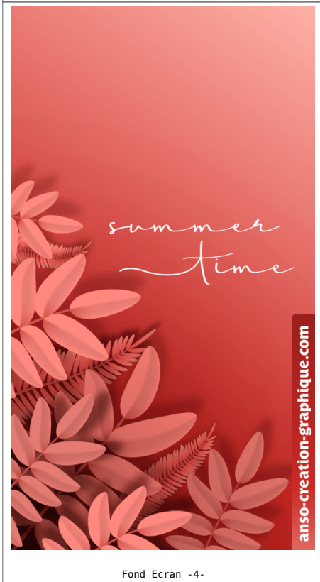
Fond Ecran -4-