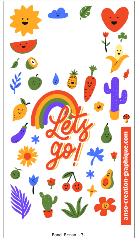
Fond Ecran -3-