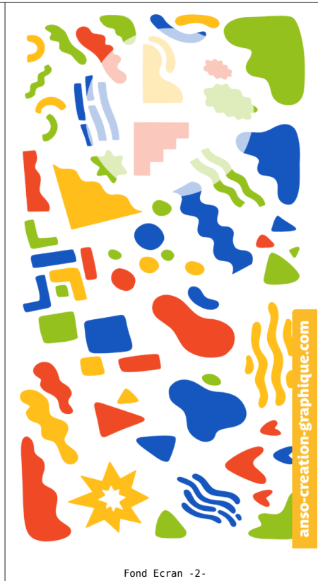
Fond Ecran -2-