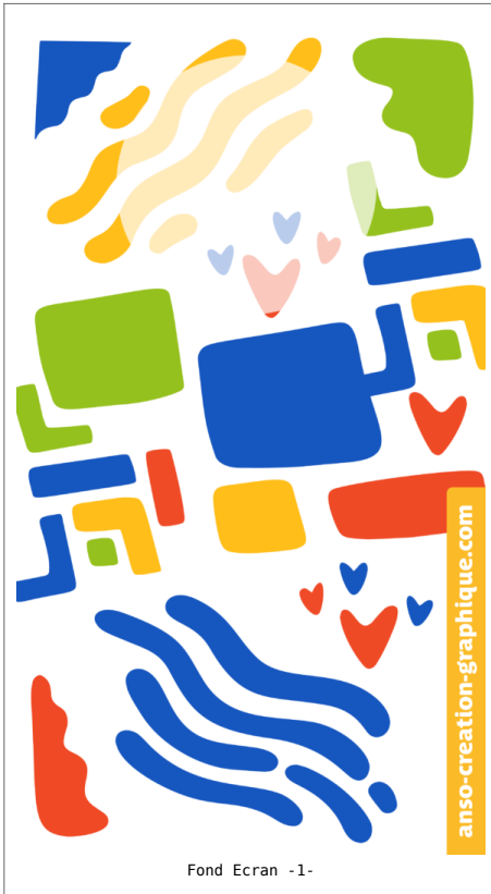
Fond Ecran -1-