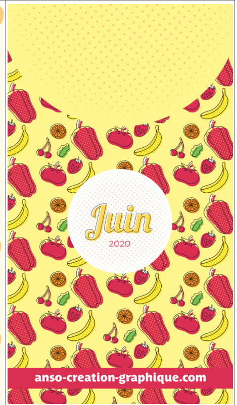
Fond Ecran -6-