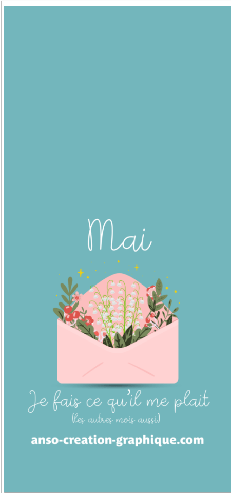
Fond Ecran -1-