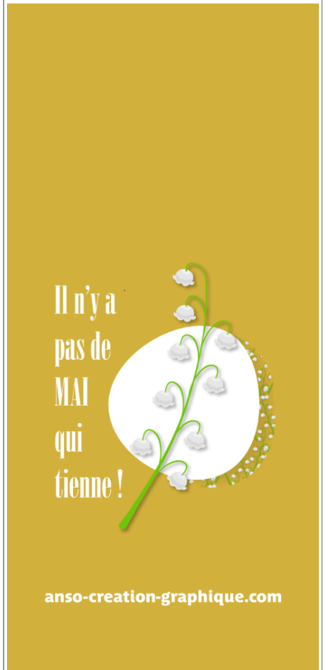
Fond Ecran -6-