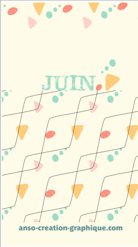
Fond Ecran -4-