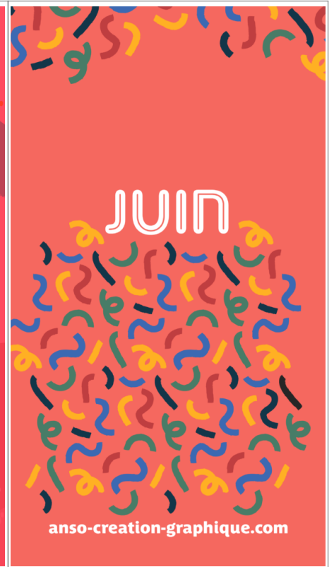
Fond Ecran -3-