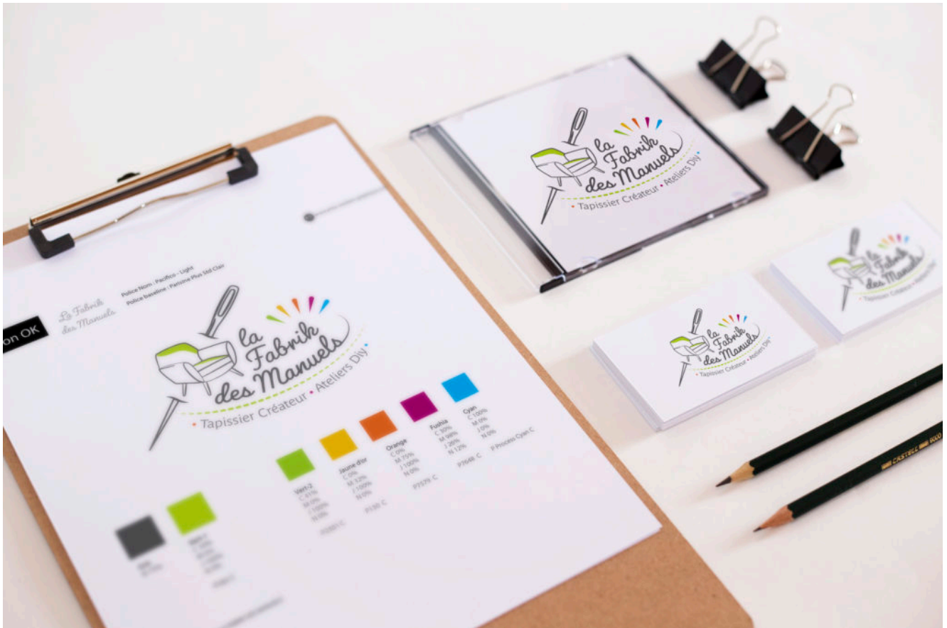
Livrable du logo, avec sa charte graphique.