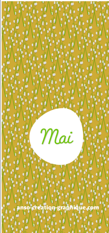
Fond Ecran -5-