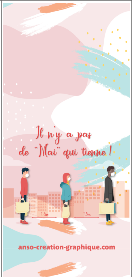
Fond Ecran -3-