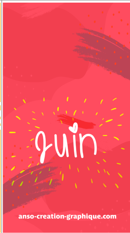
Fond Ecran -2-