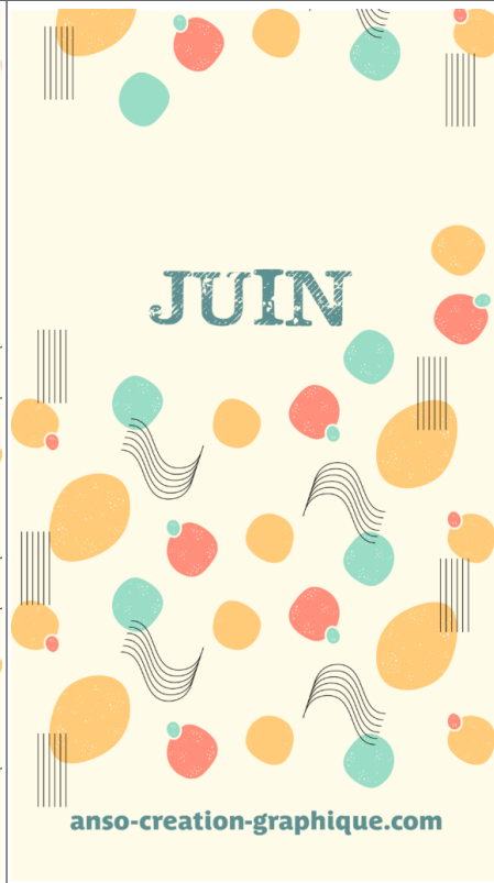
Fond Ecran -5-