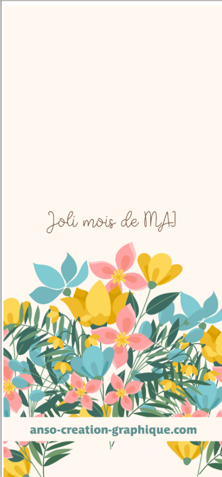
Fond Ecran -2-