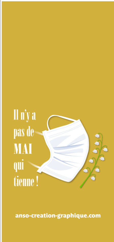
Fond Ecran -4-