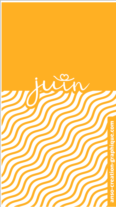
Fond Ecran -1-