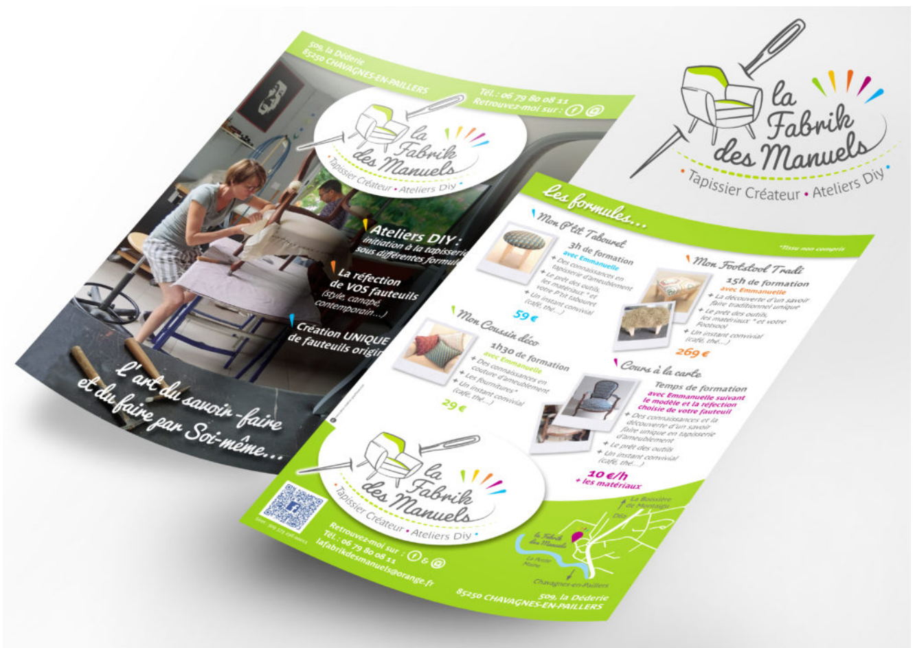
Application du logo dans un flyer.