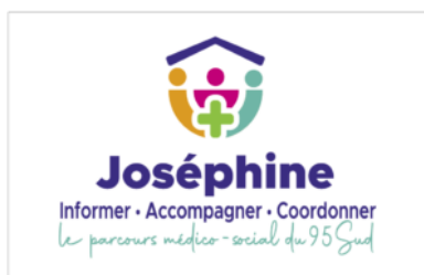
Carte de visite